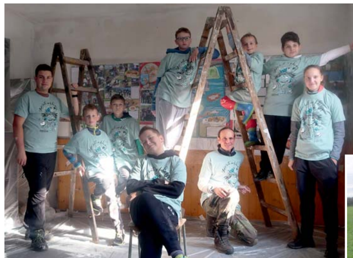
společná fotka všech, kteří se zasloužili