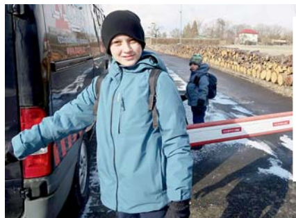
naše cesta začíná

Našli jsme čtyři kešky z pěti, a hlavně, i to hlavní – máme ŠKOLNÍ LŽIČKU!