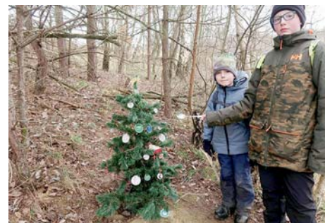
Školní lžička nalezena!