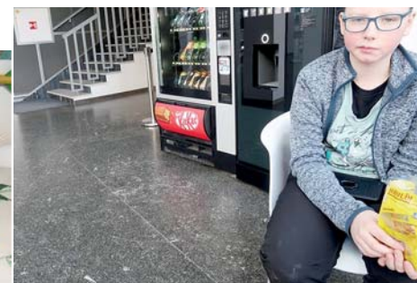
naším blátem jsme poněkud zašpinili podlahy v planetáriu